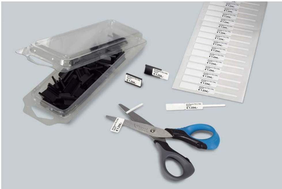
Abb.2: Anwendung Etiketten-Halter 86 EH2-S mit Schlaufen-Etikett 44 1072: gedrucktes Etikett falten, Schlaufe abschneiden und in den Halter schieben