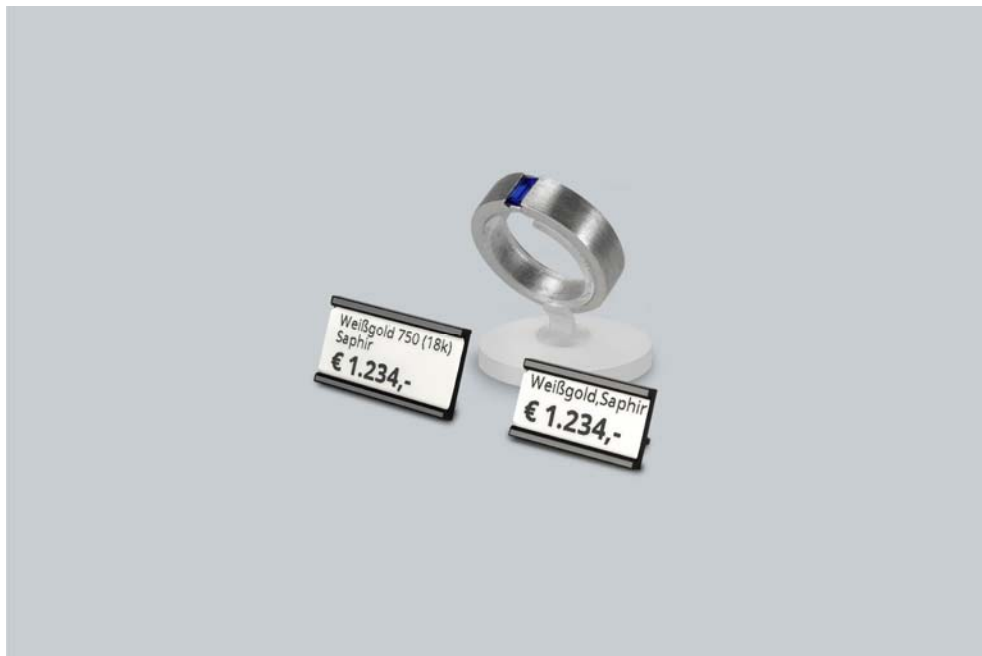
Abb.4: Größenvergleich Etiketten-Halter 86 EH1-S für Etiketten mit Beschriftungsflächen 18 x 8 mm (BxH) z.B. für Schlaufen-Etikett 34 870IR und Faden-Etikett 34 835IR (rechts), Etiketten-Halter 86 EH2-S für Etiketten mit Beschriftungsflächen 22 x 10 mm (BxH) z.B. für Schlaufen-Etikett 44 1072 und Faden-Etikett 34 1044