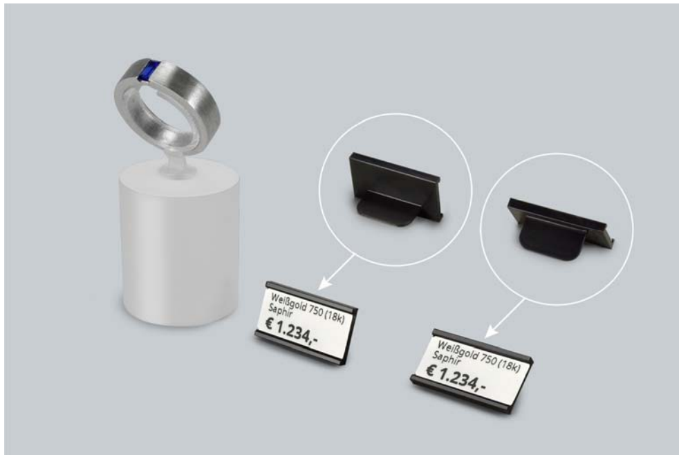
Abb.3: Etiketten-Halter von eXtra4 sind mit dem integrierten Standfuß in zwei Positionen aufstellbar: steil (70°) für Dekoration in Augenhöhe und geneigt (40°) für bequemes Lesen von oben