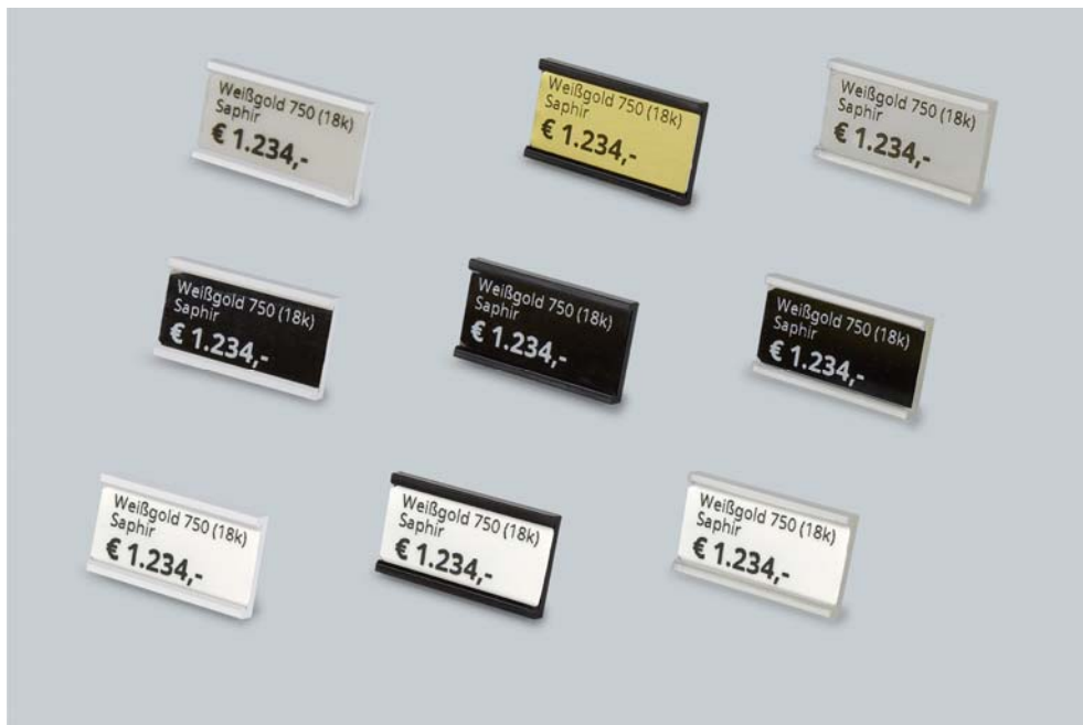
Abb.5: Optische Wirkung weißer, schwarzer und transparenter Etiketten-Halter 86 EH2 mit unterschiedlich bedruckten Etiketten in verschiedenen Farben.